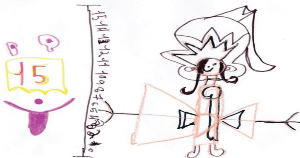
FIGURA 2 – Desenho C2 sobre a percepção da hospitalização. Pelotas, RS, Brasil, 2016.

Posteriormente, a pesquisadora solicitou que C2 explicasse a relação entre os elementos presentes no seu